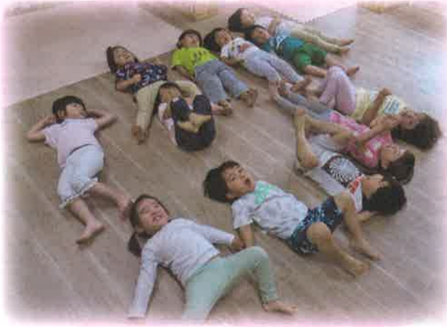
(N)KOTOともそだちネット 陽だまり保育園「こどもたちの保育室を整備しました。」

赤い羽根共同募金は子ども・家庭、高齢者、障がい者、まちづくりの推進など皆様に関わりのあるところで役立てられております。