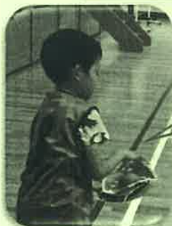
大谷選手からの グローブです!!