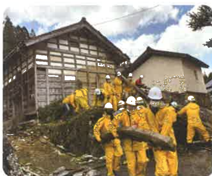
金沢工業大学の学生たちもボランティアとして応援してくれています。(穴水町)

共同募金会では、災害発生後、即座に災害支援を行えるように皆様からのご寄付金の一部を、災害等準備金として積立しています。この準備金は、被災県に設置の災害ボランティアセンターやボランティア団体の活動支援などに活用する共同募金独自の、災害時におけるたすけあいのしくみです。