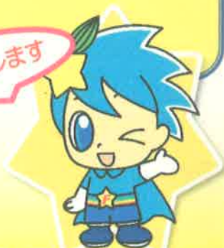
福生市協イメージキャラクター