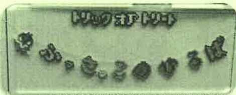
カラーポリ袋を使って ハロウィンマント作り♪