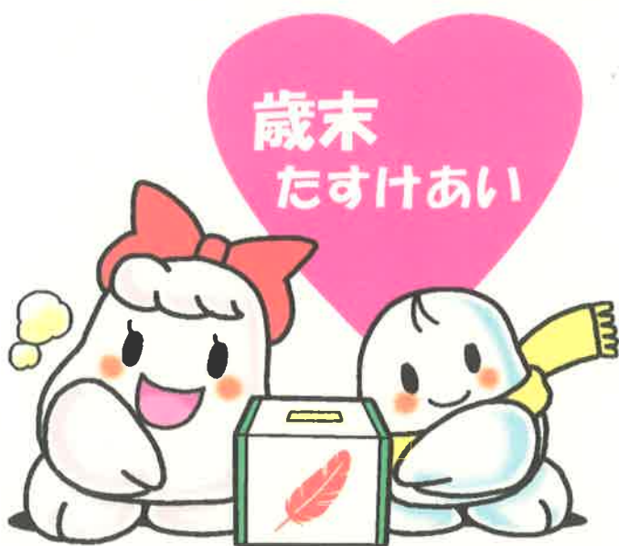
共同募金シンボルキャラクター「愛ちゃんと希望くん」

昨年行いました歳末たすけあい運動も、市民の皆様のあたたかいご協力により募金総額2,447,967円となり、各種の地域福祉活動に活用させていただきました。