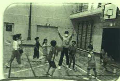
バスケットボール教室