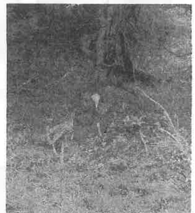
親鹿の背中を見る子鹿 (日光移動教室にて)

誉めてあげれば、子どもは、明るい子に育つ 愛してあげれば、子どもは、人を愛することを学ぶ 認めてあげれば、子どもは、自分が好きになる 見つめてあげれば、子どもは、頑張り屋になる 分かちあうことを教えれば、子どもは、思いやりを学ぶ 親が正直であれば、子どもは、正直であることの大切さを知る 子供に公平であれば、子どもは、正義感のある子に育つ やさしく、思いやりをもって育てれば、子どもは、やさしい子に育つ 守ってあげれば、子どもは、強い子に育つ 和気あいあいとした家庭で育てば、子どもは、この世の中はいいところだと思えるようになる